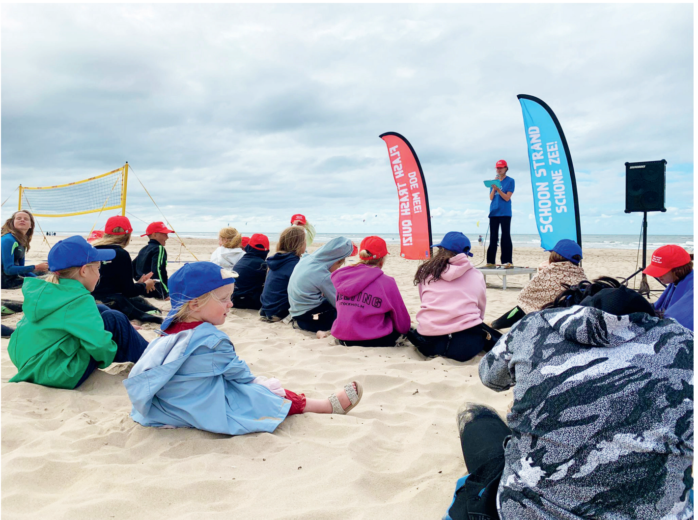
De deelnemers aan de Flash Trash Quiz doen vol enthousiasme mee. De prijs? Een gouden afvalgrijper!

Toen we dit jaar opnieuw werden gekozen uit de vele pilotprojectaanvragen die PSS ingezonden had gekregen, waren we natuurlijk ontzettend vereerd! Mede door de fijne samenwerking met Programma Schone Stranden hebben we heel veel badgasten weten te bereiken en hebben we met z'n allen het strand mooier, schoner en gezelliger gemaakt!